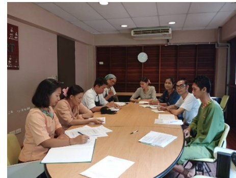
Travelife leader team meeting ประชุมทีมผู้นำ Travelife