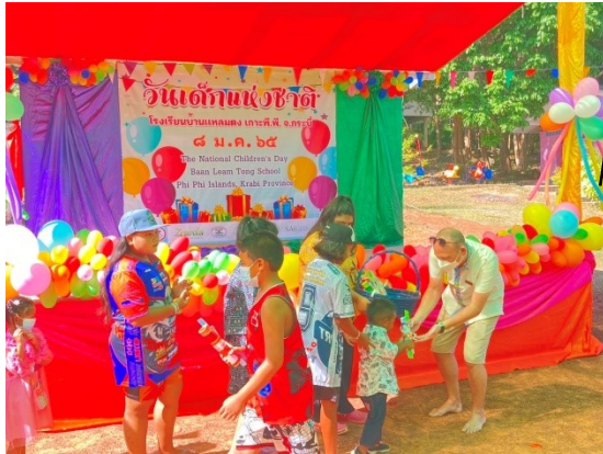
Children's Day 8 January 2022 วันเด็กแห่งชาติ 8 มกราคม 2565