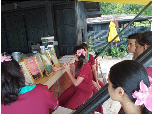
F&B training: FB package เทรนนิ่งของแผนกอาหารและเครื่องดื่ม