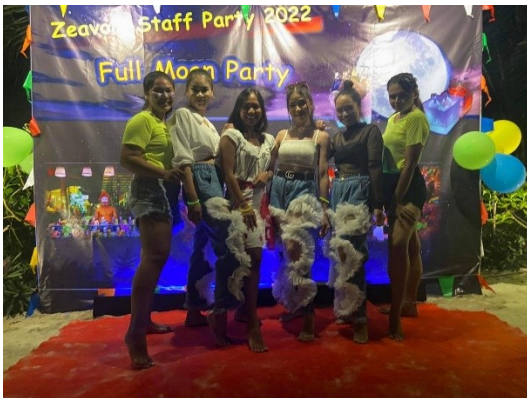
Staff Party September 2022 งานเลี้ยงสังสรรค์พนักงาน กันยายน 2565