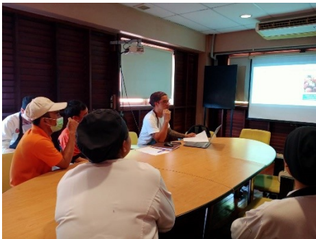
Travelife Training for Kitchen staff เทรนนิ่ง travelife ให้กับ พนักงานครัว