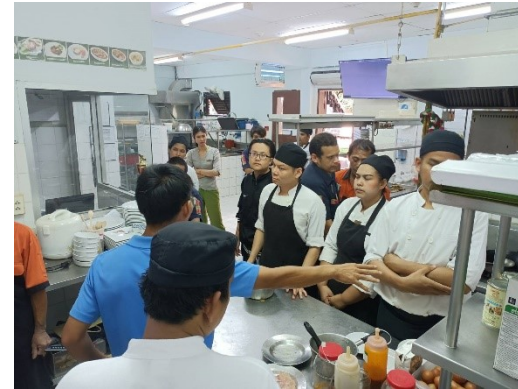
Gas detector training เทรนนิ่งหัวข้ออุปกรณ์ทางด้านความปลอดภัย