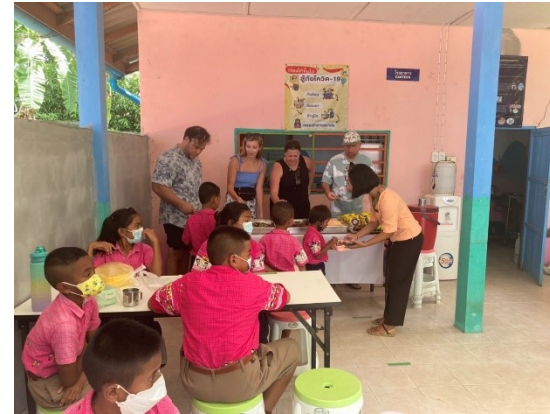
Laemtong School Lunch every Friday เลี้ยงอาหารกลางวันนักเรียน โรงเรียนแหลมตงทุกวันศุกร์