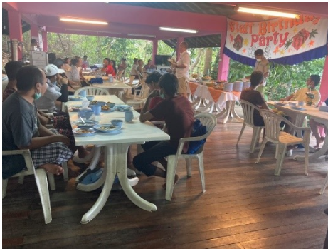
Staff Monthly Birthday party เลี้ยงวันเกิดพนักงาน ประจำเดือนทุกเดือน