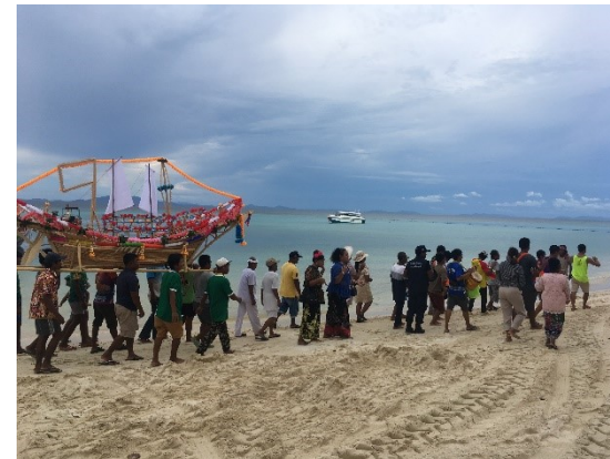
Sea gypsy boat floating traditional festival ประเพณีลอยเรือของชาวบ้าน แหลมตง