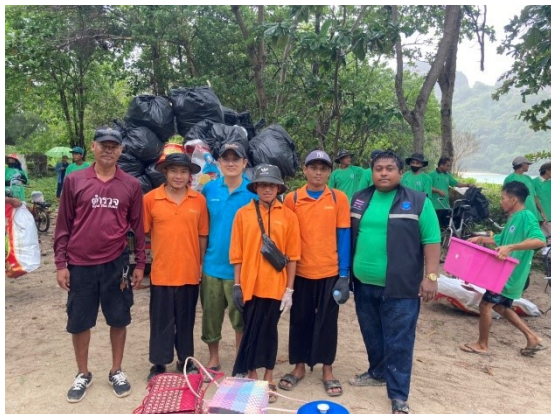
Clear rubbish at Loh Lana with local community 15 October 2022 เก็บขยะที่โล๊ะลาน่า 15 ตุลาคม 2565