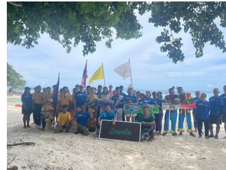
Sport day 18-19 Sep 2022 กีฬาสี 18-19 กันยายน 2565